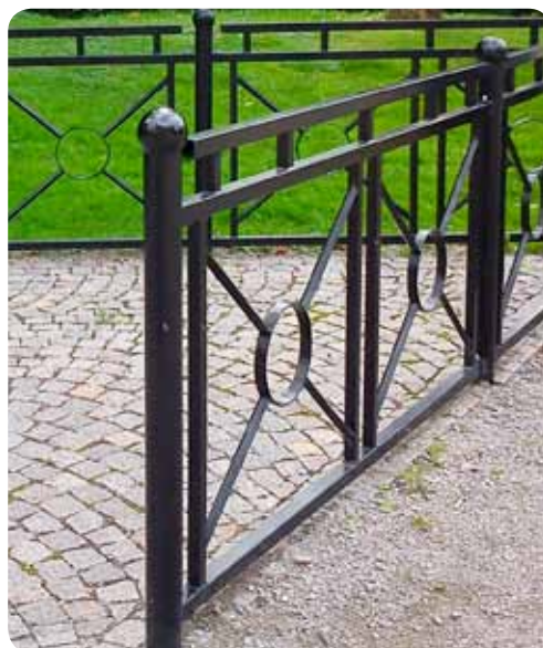
Prydnadsräcke, varmförzinkat och pulverlackerat

Även varmförzinkade skyddsräcken till andra typer av trafikmiljöer har levererats av SMEKAB, bl a stolpar till vägmittbarriärer i form av vajerräcken, vilka skyddar mot mötesolyckor.