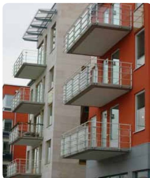
Balkongräcke, Hammarby Sjöstad Stockholm

På kort tid, med mycket god flexibilitet och väl utnyttjade produktionsresurser, levererade SMEKAB flera kilometer monteringsfärdiga balkongräcken till Hammarby Sjöstad i Stockholm.