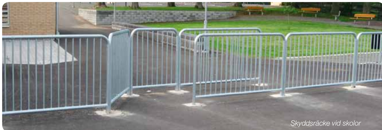
Skyddsräcke vid skolor