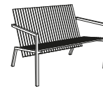
LA245 120 x 72 x 76 cm